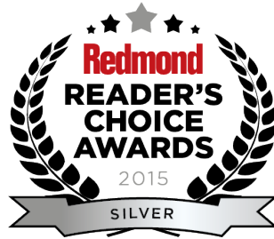
Redmond Reader's Choice Awards - Migration Tool

crezca. Las soluciones de Quest® son escalables, rentables y simples de usar, y proporcionan eficiencia y productividad inigualables. Además de la invitación de Quest para que la comunidad global participe de esta innovación y de nuestro firme compromiso para garantizar la satisfacción del cliente, Quest continuará con la aceleración de la entrega de las soluciones más integrales para la administración de la nube de Azure, SaaS, seguridad, movilidad del personal e información impulsada por datos.