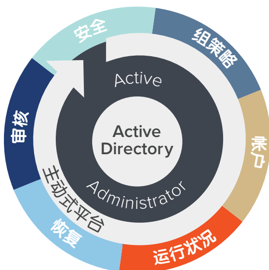
图1. Active Administrator交付用于管理Active Directory的全面解决方案。

安全管理 — 精简了安全策略和权限的实施过程以提高工作效率。您能够快速识别拥有过多权限的用户并清理他们的帐户。您还可以使用可定制且可重用的自我修复